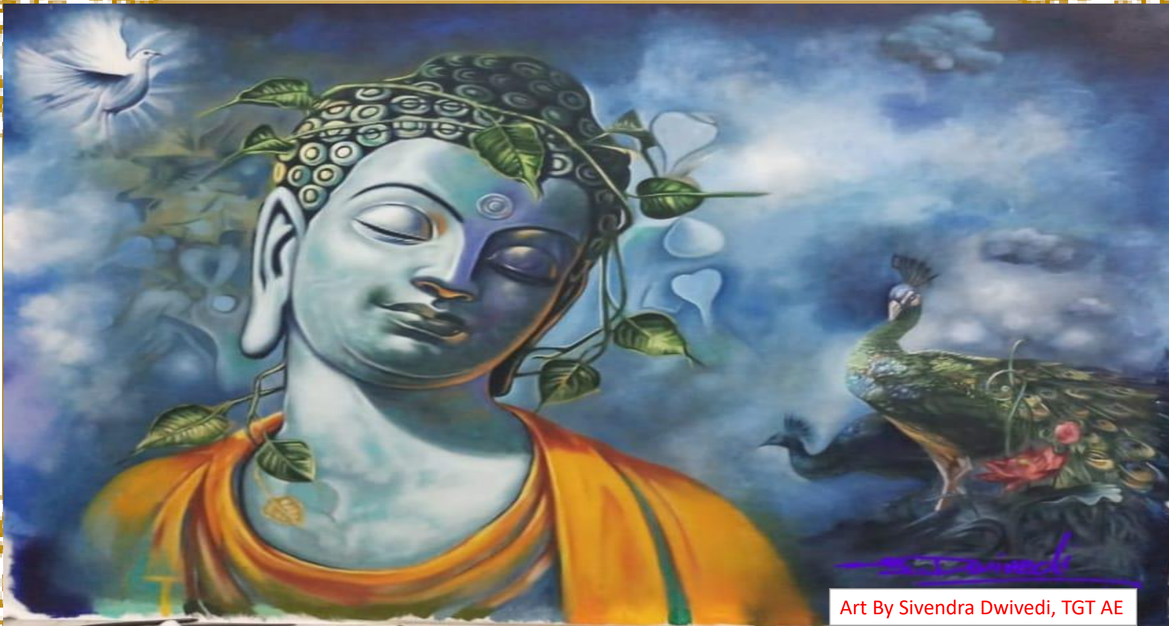
Art By Sivendra Dwivedi, TGT AE